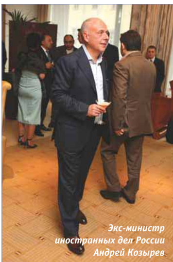
Экс-министр иностраннных дел России Андрей Козырев