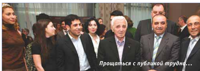
Прощаться с публикой трудно...