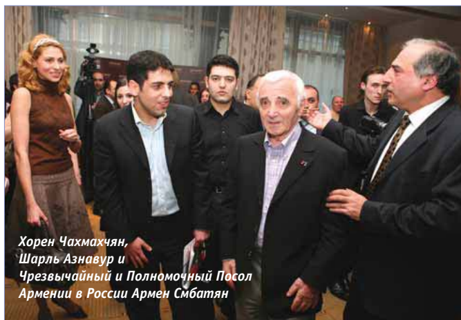
Хорен Чахмахчян, Шарль Азнавур и Чрезвычайный и Полномочный Посол Армении в России Армен Смбадян