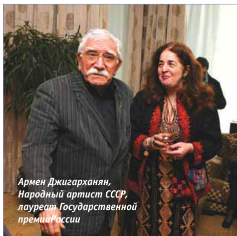
Армен Джигарханян, Народный артист СССР, лауреат Государственной премии России