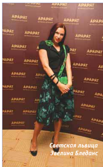
Светская львица Эвелина Бледанс