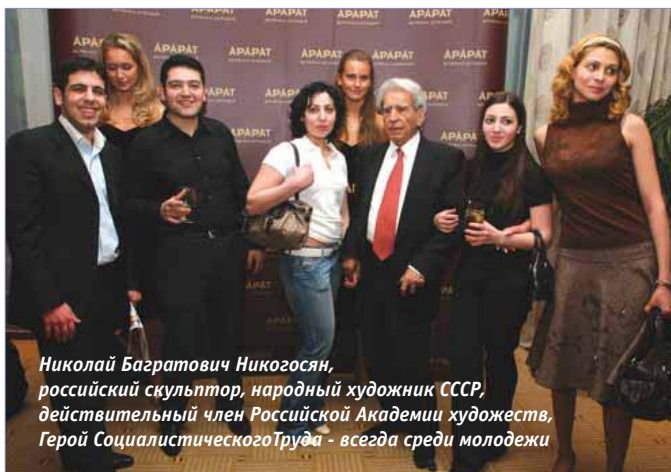
Николай Багратович Никогосян, российский скульптор, народный художник СССР, действительный член Российской Академии художеств, Герой Социалистического Труда - всегда среди молодежи