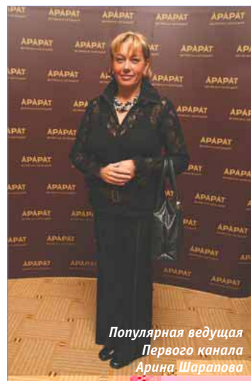
Популярная ведущая Первого канала Арина Шаропова